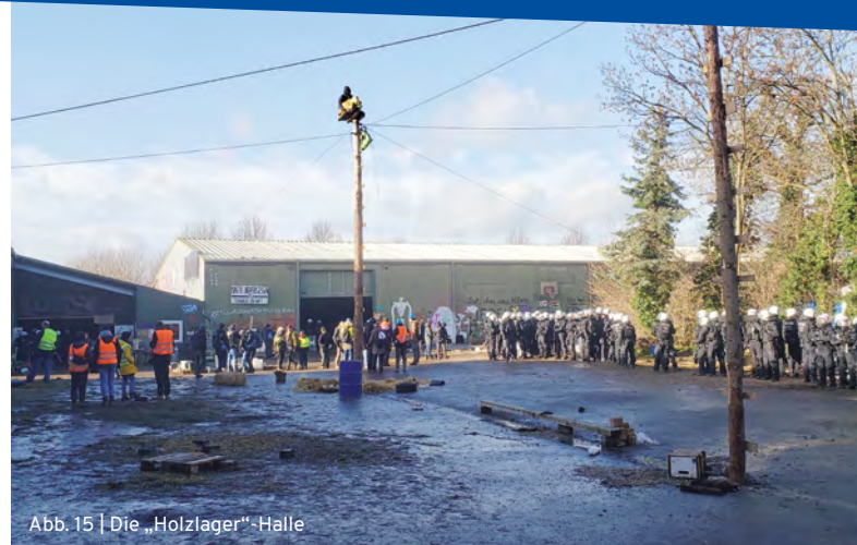
Abb. 15 | Die „Holzlager“-Halle

Die „Holzlager“-Halle ist noch besetzt: Aktivist*innen befinden sich darin auf einer Plattform unterm Dach, Polizist*innen stehen vereinzelt in der Halle herum. Es ist sehr ruhig. Eine Polizeireihe sichert die Türen, darunter Beweissicherungsteams und mehrere Polizeibeamt*innen in Zivil mit gelben Westen, die sie als „Verbindungsbeamte“ ausweisen. Auf dem Platz davor, zwischen der „Holzlager-Halle“ und dem „Phantasialand“, steht eine Doppelreihe Polizei mit Helmen und Schilden, alles Polizei aus NRW. Weiterhin stehen dort zwei große besetzte Monopods, die miteinander verbunden sind (Abb. 15).