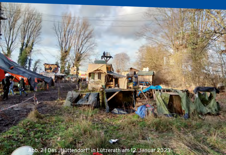
Abb. 2 | Das „Hüttendorf“ in Lützerath am 12. Januar 2023

Am 12. Januar wurden die Alte Mahnwache und die geräumte „Eibenkapelle“ zerstört und dem Erdboden gleichgemacht. 21 Die Hallen wurden eingerissen und mit dem „Haus der Unbekannten“ (HDU) das erste Gebäude geräumt, sowie das „Hüttendorf“ (Abb. 2) und Teile der „Reihenhaussiedlung“ sowie Pods und Barrikaden. Erste Bäume im „Wäldchen“ wurden direkt neben besetzten Bäumen und Traversen gefällt, um den Lützerather Wald herum wurde ebenfalls begonnen, Bäume zu fällen. Am Abend wurde bekannt, dass zwei Aktivist*innen in einem Tunnel ausharren, die Polizei stellte die Räumung zunächst ein.