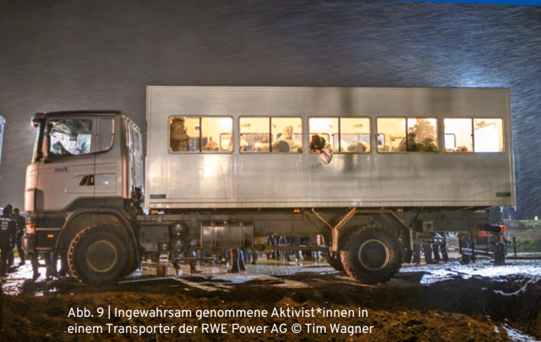
Abb. 9 | Ingewahrsam genommene Aktivist*innen in einem Transporter der RWE Power AG