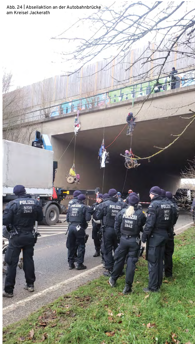
Abb. 24 | Abseilaktion an der Autobahnbrücke am Kreisel Jackerath

Heute gibt es seit dem frühen Morgen eine Abseilaktion an der Autobahnbrücke am Kreisel Jackerath (Abb. 24). Fünf Menschen blockieren dort abgeseilt von einer Brücke eine Straße, zwei davon befinden sich in Rollstühlen; ein dritter Rolli steht für eine*n angeseilten Aktivist*in mit Begleitperson bereit. Wir treffen Demo-Sanitäter*innen an der etwa 100 Meter entfernten Straßenkreuzung. Sie erzählen, dass sie seit 6:30 Uhr vor Ort sind, aber des Platzes verwiesen wurden, da „sie nicht gebraucht werden“. Die Polizei habe genügend Fachkräfte, so dass die Sanitäter*innen die Räumung nur verzögern würden.