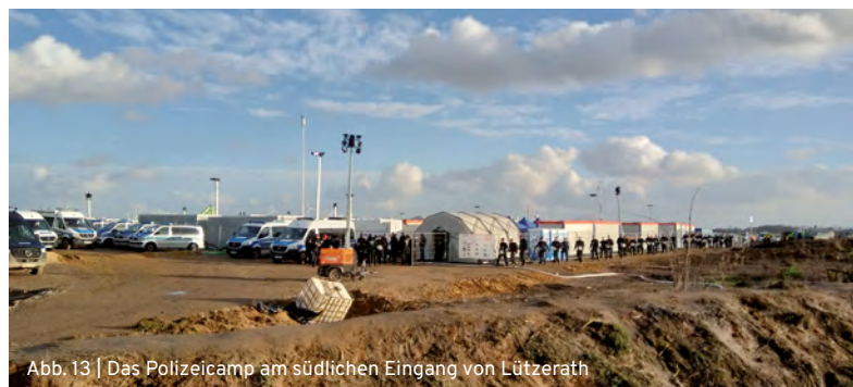
Abb. 13 | Das Polizeicamp am südlichen Eingang von Lützerath

Eine Barrikade aus Ästen, Pfählen und anderem trennt das Polizeicamp zusätzlich vom nördlichen Tagebauvorfeld.