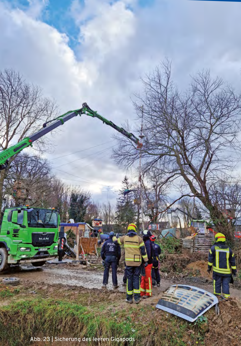
Abb. 23 | Sicherung des leeren Gigapods

Wir zählen acht Aktivist*innen in verschiedenen Bäumen oder Traversen. Von Hebebühnen aus holen SEK-Kletterer nacheinander alle aus den Bäumen oder Traversen. Noch vor 14 Uhr ist die letzte Person aus „Phantasialand“ geräumt. Sie werden in recht freundlicher Weise an uns vorbei vor den Zaun eskortiert, dort können sie dann unbehelligt gehen. Einer hat aus dem Baumhaus seinen Rucksack und eine Reisetasche mitgenommen.