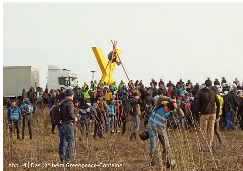
Abb. 14 | Das „X“ beim Greenpeace-Container

Wir verlassen das Gelände gegen 15 Uhr und beenden die Beobachtung an diesem Tag.