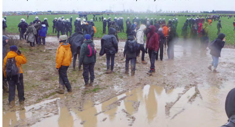
Abb. 21 | Aktivist*innen auf einem Feld zwischen Keyenberg und Lützerath

Team 1: Gegen 11 Uhr im Ort Keyenberg sind schon viele Aktivist*innen da, die zum Teil versuchen, von einem Wall einen Blick in die Tagebaugrube zu werfen (Abb. 21). Von einem Standplatz in der Nähe kommt berittene Polizei. Wir zählen sechs Reiter*innen plus Pferde in gelben Regenmänteln und 20 Reiter*innen in schwarzer Kluft. Sie reiten einen Weg hinab in die Kohlegrube. Von den Haltepunkten der Shuttle-Busse zieht ein ununterbrochener Strom weiterer Aktivist*innen heran.