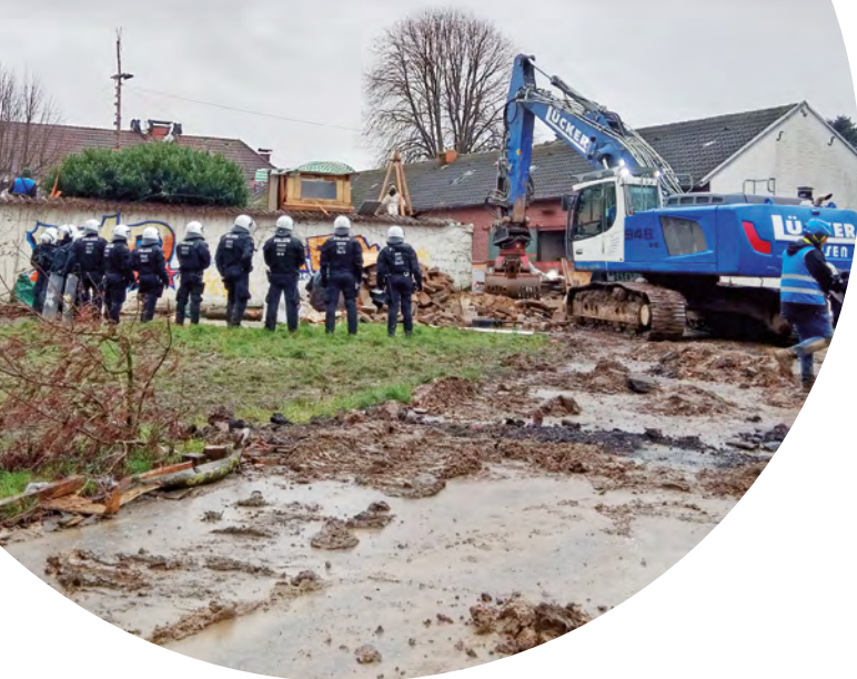
Abb. 18 | Ein Bagger am besetzten Hof „Paula“ reißt Barrikaden und Mauern weg.

Auf dem Rückweg von Lützerath auf dem Keyenweg, der aufgrund der großen Wasserlachen aufgrund des Regens teilweise unpassierbar ist, treffen wir um 15:30 Uhr auf einen Kessel mit circa 60 sitzenden Aktivist*innen (Kessel 2). Sie waren einige Stunden früher von einer angemeldeten Demonstration aus Keyenberg kommend über das Feld Richtung Lützerath ausgebrochen. Darunter waren Aktivist*innen von Greenpeace, Extinction Rebellion, FFF und darunter Luisa Neubauer.