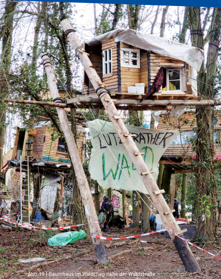
Abb. 19 | Baumhaus im Wäldchen nahe der Waldstraße

„Am 13.01.2023 am Vormittag wurden alle Personen aus den Häusern Lützerath 9 und 10 geräumt. Wir befanden uns auf dem Dachboden der Nummer 9. Es gab dort zwei Personen, die sich an einen Dachbalken angeklebt und aneinander gekettet hatten, drei Personen mit den Armen in Lock-Ons, die aus Plastikröhren bestanden, zwei Streichmusiker und etwa drei Journalist*innen. Zwei weitere Personen waren unten im Haus. Ich war mit im Lock-On. Während wir die Ankunft der Polizei abwarteten, hörten wir per Funk eine weinende Person, die beschrieb, wie gerade vor ihren Augen Pappeln in Lützerath gefällt wurden, in denen Menschen in der Höhe gesichert waren. Als die Polizei über eine Leiter die erste Etage erreichte und das Fenster einschlug, begannen die Streicher zu spielen und wir zu singen. Unter Gesang und Rufen kamen Polizist*innen auf den Dachboden, über eine schmale Leiter. Sie schickten sofort die Journalist*innen weg. Danach forderten sie die Streicher auf zu gehen, was die dann auch taten. Dann begannen Spezialkräfte und normale Polizist*innen damit, die angeklebten Leute zu lösen. Dabei klagte eine Person darüber, dass an ihrer Hand gerissen wurde, die noch festklebte. Danach wurden die Lock-Ons aufgesägt. Die Einsatzkräfte erklärten uns, dass sie eine spezielle Säge benutzten, einen Oszillator, der in der Regel