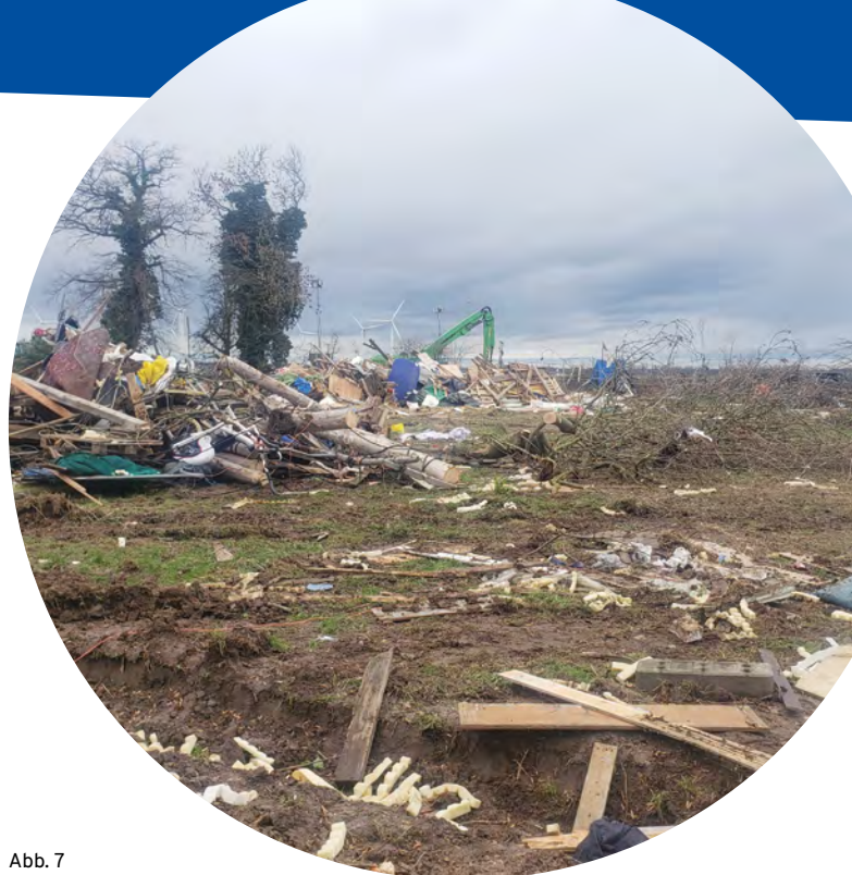
Abb. 7 Ein Bild der Zerstörung: Lützerath nach der Räumung

Am 16. Januar verließen als letzte Besetzer*innen die Tunnelbewohner*innen Pinky und Brain den Tunnel. Lützerath war damit nach fünf Tagen vollständig geräumt (Abb. 7).