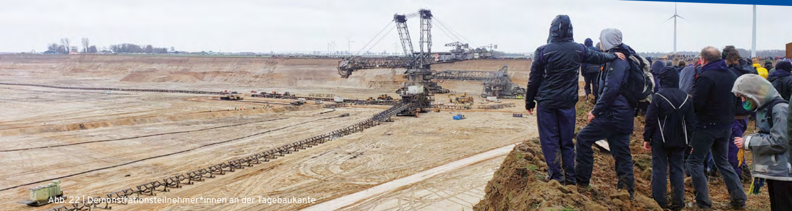
Abb. 22 | Demonstrationsteilnehmer*innen an der Tagebaukante

Immer wieder durchqueren einzelne Aktivist*innen diese Kette. Die Polizei stößt Menschen zurück, schubst und drängt mit den Schilden. Als immer mehr Leute versuchen, durch die Kette zu gelangen, werden Pfefferspray und Schlagstock eingesetzt. Ein Aktivist wird mit einer blutenden Kopfwunde zurückgebracht und von Demo-Sanitäter*innen versorgt. Von hinten kommt Polizei-Verstärkung aus NRW, die sich in die Polizeikette einreihen. Der Schlamm führt zu einer Verlangsamung aller Bewegungen, nur einmal kann die Polizei eine Demonstrant*in erwischen und zu Boden bringen, aber dann lässt sie die Person in die Demo zurückkehren.