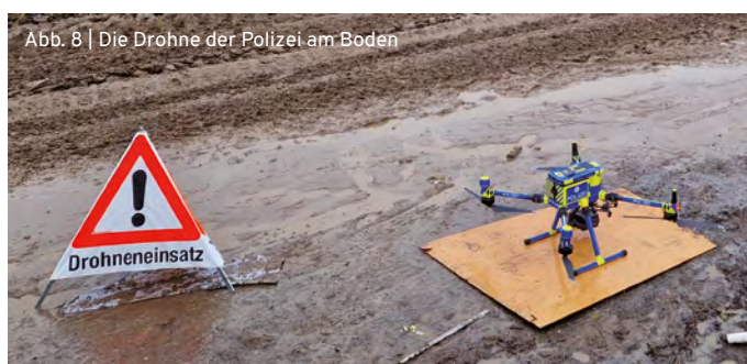
Abb. 8 | Die Drohne der Polizei am Boden

Neben unzähligen Polizeieinsatzfahrzeugen waren Wasserwerfer und Räumpanzer im Einsatz, sowie Hebebühnen und andere Spezialfahrzeuge der Polizei. Wir sahen eine Vielzahl an Polizeihunden mit ihren Hundeführern, sowie in der Spitze bis zu 28 Reiterpaare. Eine große Polizeidrohne flog während der gesamten Räumungstage über dem Gelände (Abb. 8). 26