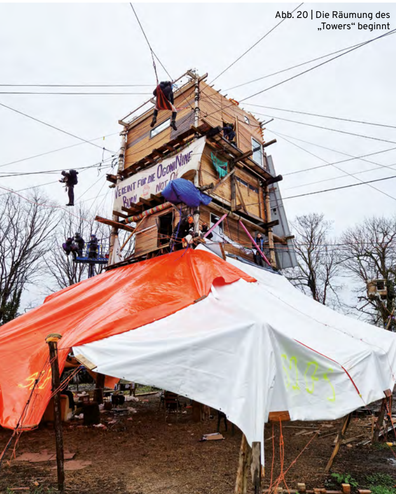
Abb. 20 | Die Räumung des „Towers“ beginnt

wahrscheinlich den „Tower“. Kurz darauf kommt nochmal dieselbe Ansage von einem weiteren Polizisten. Die Polizei weist drei hinzu gerufene Sanitäter*innen an, in der Nähe des „Towers“ zu bleiben. Bei der Person mit Lock-On werde in Kürze begonnen, dieses aufzuhebeln, „da könne auch mal etwas schief gehen.“ Die drei Sanitäter*innen postieren sich daraufhin mit Material rund 20 Meter entfernt vom „Tower“.