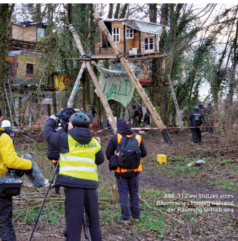
Abb. 3 | Zwei Stützen eines Baumhauses kippten während der Räumung seitlich weg