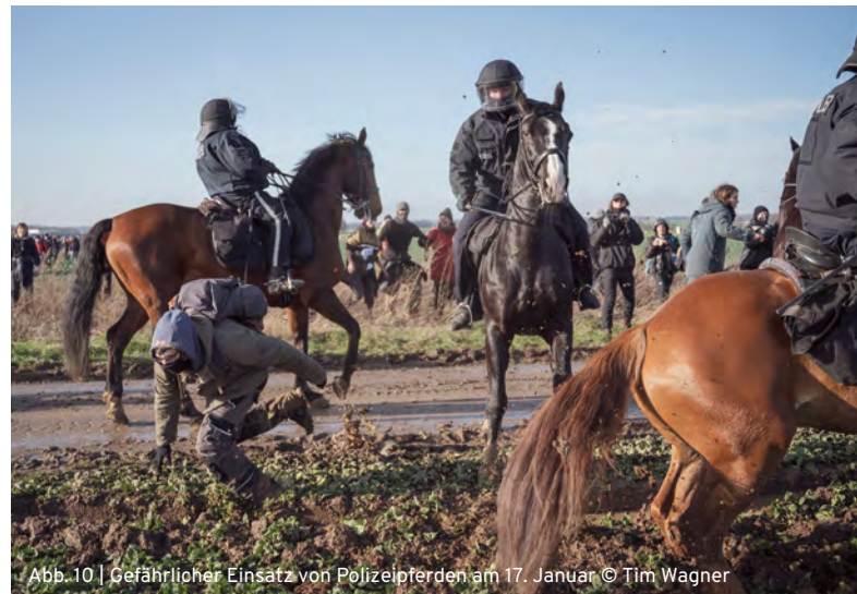
Abb. 10 | Gefährlicher Einsatz von Polizeipferden am 17. Januar

Nach einiger Zeit verließen an verschiedenen Stellen Personen die angemeldete Route und durchflossen teilweise Polizeiketten. Die Polizei reagierte an beiden Demonstrationstagen mit dem unvermittelten Einsatz von Pfefferspray und Schlagstöcken. Einzelne Personen wurden gezielt herausgezogen und durch körperliche Gewalt zu Boden gebracht und auf ihre Personalien kontrolliert. Besonders am 17. Januar fielen die eingesetzten Pferdestaffeln auf. Immer wieder konnten auch wir Situationen beobachten, in denen Pferde in die Demonstrationsteilnehmer*innen hineingeritten wurden (Abb. 10). Sie wurden nicht nur zur Abschreckung und zum Aufhalten von Personen eingesetzt, sondern auch gezielt, nicht nur gegen sich nach vorn bewegende, sondern auch gegen stehende oder gar sitzende Personengruppen eingesetzt. Ein Vorgehen, welches in mindestens zwei Fällen zu panikähnlichen Situationen bei einzelnen Teilnehmer*innen geführt hat.