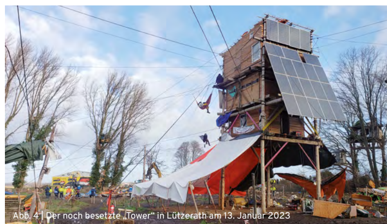
Abb. 4 | Der noch besetzte „Tower“ in Lützerath am 13. Januar 2023

Zeitgleich zu den Räumungsarbeiten fällt RWE die Pappeln an der Straße zur Mahnwache mit Harvestern, während sich dort noch Menschen mit ihren Klettergurten in Traversen befanden. Die Monopods auf der Zeltwiese wurden zerstört und die Hallen weiter abgerissen. Im „Wäldchen“ wurden erste Baumhäuser zerstört. Das denkmalgeschützte Backsteinhaus von Eckardt Heukamps Hof wurde abgerissen.