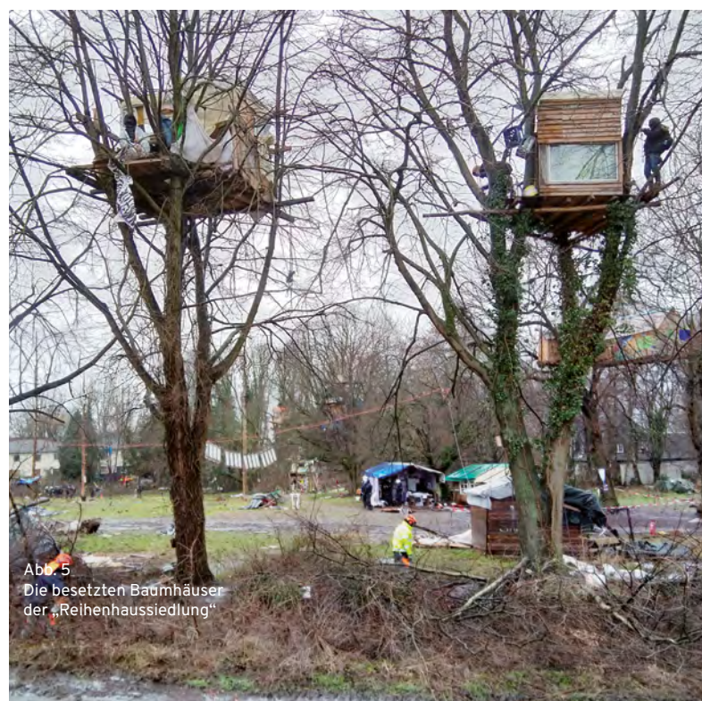
Abb. 5 | Die besetzten Baumhäuser der „Reihenhaussiedlung“

Am 14. Januar ging die Zerstörung weiter mit dem Abriss des Wohngebäudes von Eckardt Heukamps Hof. Die letzten Baumhäuser der „Reihenhaussiedlung“ (Abb. 5) wurden