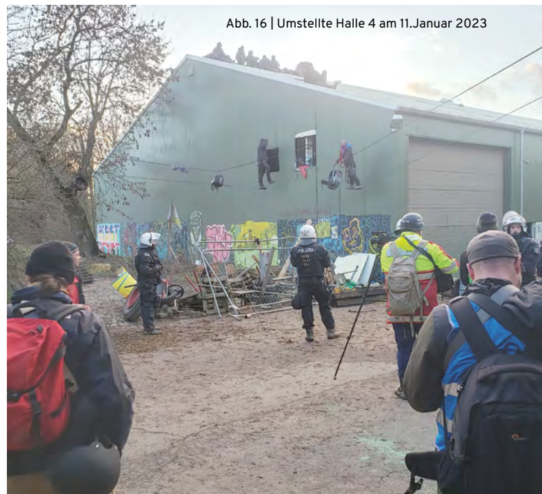
Abb. 16 | Umgestellte Halle 4 am 11. Januar 2023

Wir sehen außerdem eine Gruppe Besetzer*innen auf dem Dach von Halle 4 sitzend, sowie zwei Menschen in Traversen am Kopfende der Halle (Abb. 16). Dorthin marschieren 10 Polizist*innen mit schwarzen Helmen, etwas später folgen neun Beamt*innen einer Polizei-Klettereinheit – vermmummt und in Tarnkleidung – sowie Sanitäter*innen der Polizei. Gegen 15:30 Uhr wird Halle 4 innen vollständig geräumt, Aktivist*innen berichten, Personen werden von der Plattform gezerrt, während sie im Lock-On sind. Es gibt kein Technikteam zur Lösung aus den Lock-Ons.