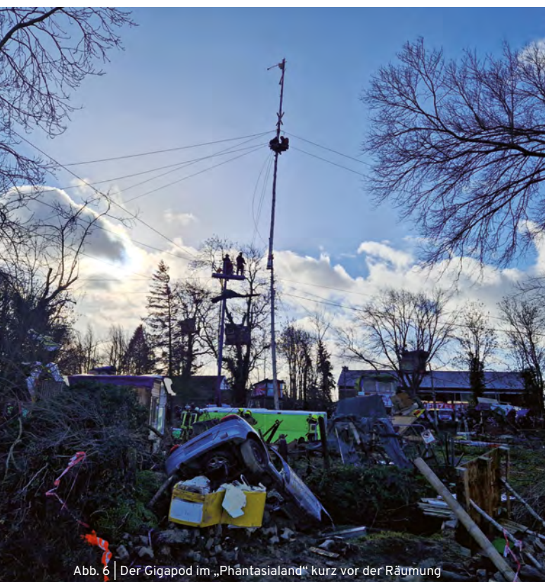
Abb. 6 | Der Gigapod im „Phantasialand“ kurz vor der Räumung

Am 15. Januar wurde das „Wäldchen“ dann vollständig geräumt, Aktivist*innen hatten dort nachts neue Traversen gespannt. Weiterhin wurden die letzten verbliebenen Aktivist*innen aus besetzten Strukturen, u.a. dem Gigapod, im „Phantasialand“ mit Hebebühnen geräumt (Abb. 6). Parlamentarische Beobachter*innen versuchten, einen Kontakt zum weiterhin besetzten Tunnel herzustellen.