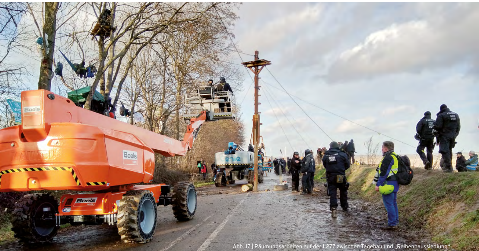
Abb. 17 | Räumungsarbeiten auf der L277 zwischen Tagebau und „Reihenhausiedlung“

Am Abend werden die Hallen geräumt, es werden mehrere Lichtmasten aufgestellt. Gegen 21:30 Uhr werden die 15 Aktivist*innen vom Hallendach 1 neben der ehemaligen Küfa-Halle geräumt. 67